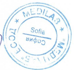
Светла Чилингирова Управител на Медилаб ЕООД